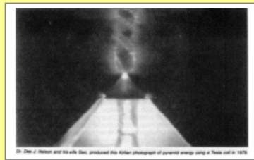
Vortex d'énergie avec la photographie Kirlian